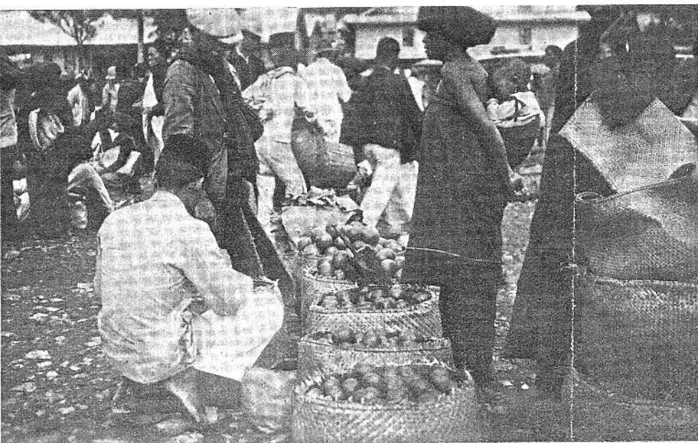
Een kijkje op een marktdag te Brastagi. Op de voorgrond zakken met sinaasappelen, waarbij Batakkors staan